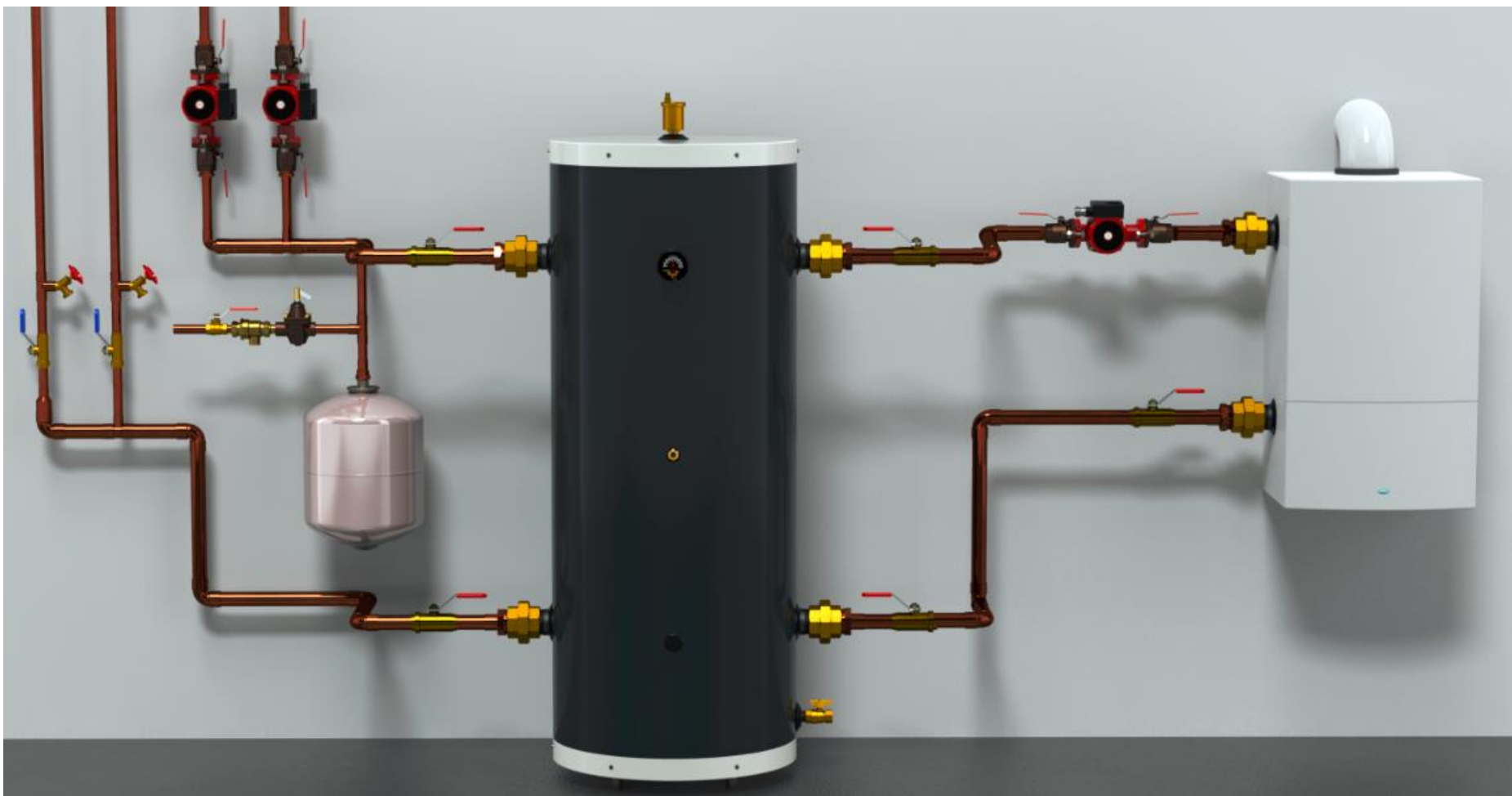
Figure 2: Installation typique du BUFFMAX